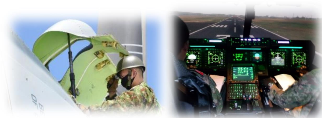
安全対策措置の様子（イメージ）

日々の飛行の際に事前に作成する運用計画についても、「特定の部品の不具合」による事故を防ぐための手順を整理し、この計画に反映させます。