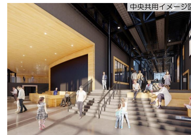
中央共用イメージ図

また、災害時には地域住民の避難所としての利用に配慮するとともに、災害ボランティアセンターの設置・運営が円滑に行える計画とします。