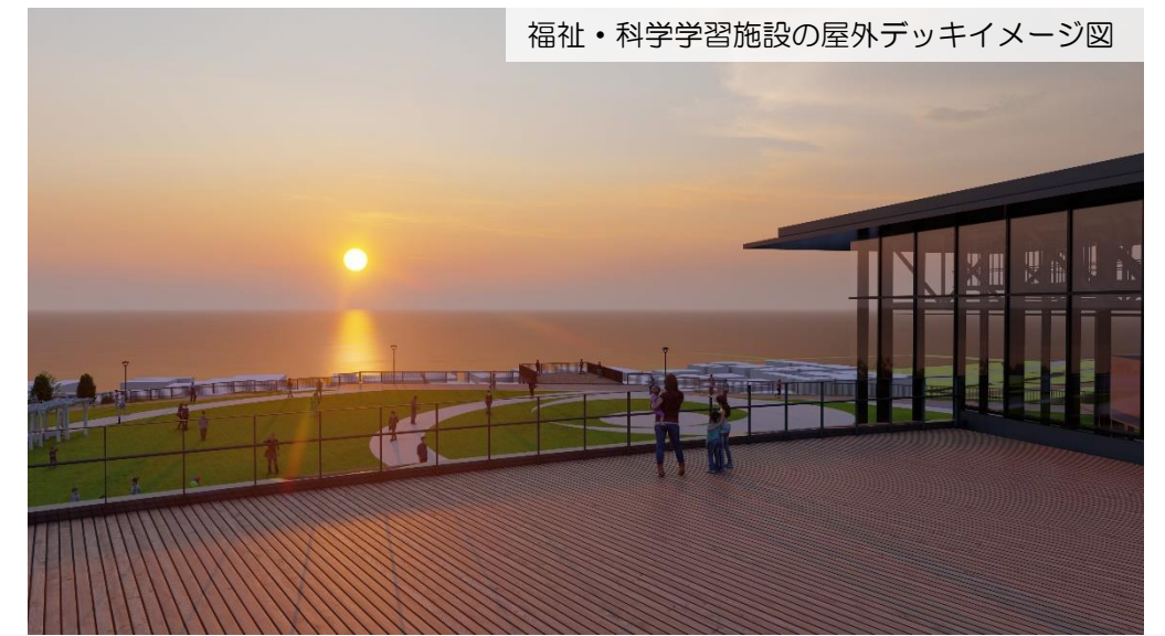
福祉・科学学習施設の屋外デッキイメージ図