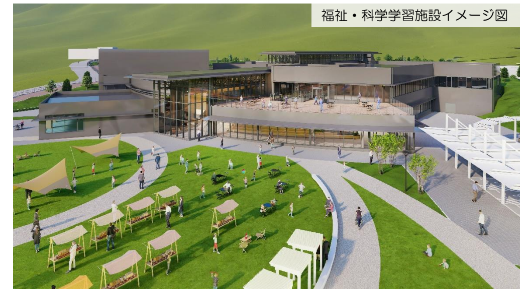
福祉・科学学習施設イメージ図