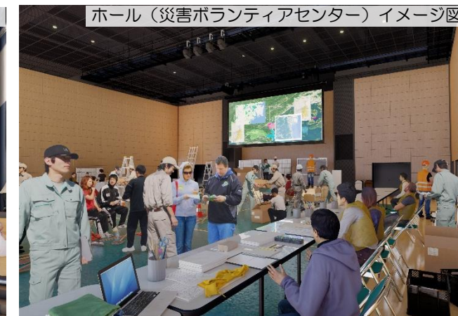
ホール（災害ボランティアセンター）イメージ図