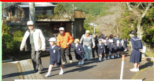
小・中・高校・地域合同の避難訓練