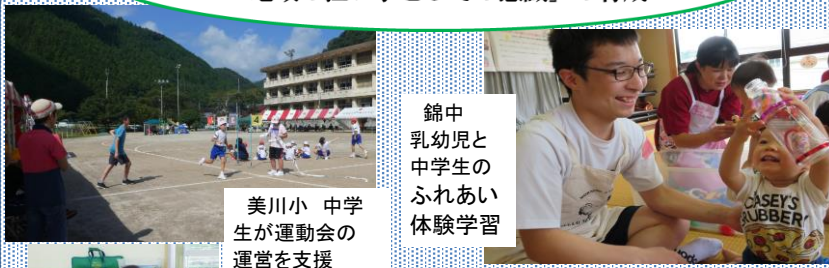
美川小 中学生が運動会の運営を支援