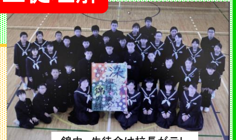
錦中 生徒会は校長が示した学校経営概要を元にチャレンジ目標を考えます