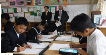
6年生が中学校で体験学習

共通の『学習の手引き』及び『家庭生活・学校生活のめあて』を全家庭に配布し、学校と家庭が連携して小中学校の教育がなめらかなつながるように配慮