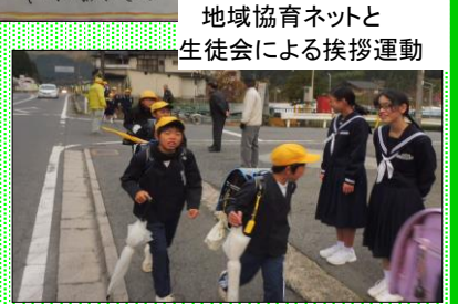
地域協育ネットと生徒会による挨拶運動

従来の取組を基礎的・汎用的能力を育成する視点でとらえ直し、授業改善を進めています。