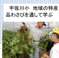
宇佐川小 地域の特産品わさびを通して学ぶ

学校運営協議会のバックアップで人的・物的支援が充実 錦・美川地域協育ネットでも子供の体験を広げる 様々な活動体験の場面を提供