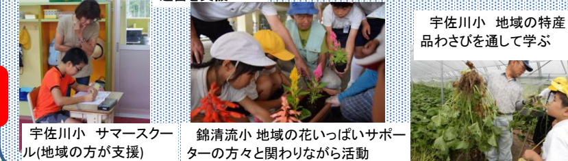
宇佐川小 サマースクール(地域の方が支援) 錦清流小 地域の花いっぱいサポーターの方々と関わりながら活動