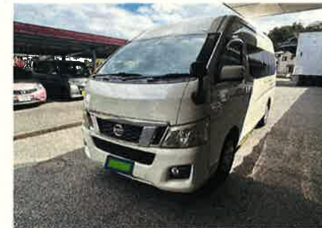
ジャンボタクシー (この車両に変更となります)