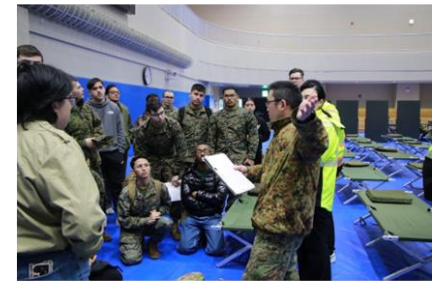
一次避難所での避難民受け入れ