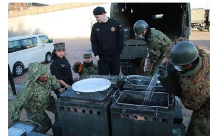
日米共同による炊事