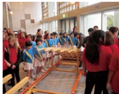
▲開演前のロビーで、日米の児童生徒が協力して錦帯橋の模型を組み立て、完成時には大きな拍手と歓声で盛り上がった