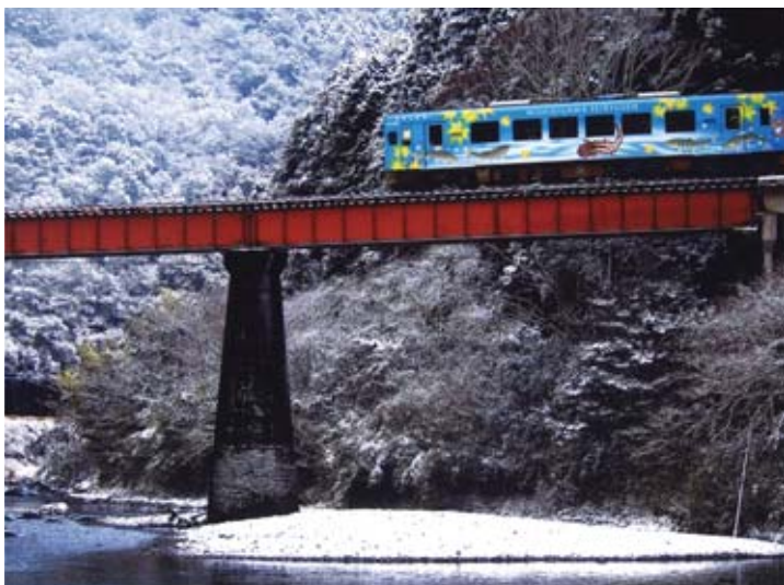
※列車の車体をよく見ると…？