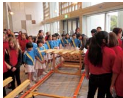
▲開演前のロビーで、日米の児童生徒が協力して錦帯橋の模型を組み立て、完成時には大きな拍手と歓声で盛り上がった