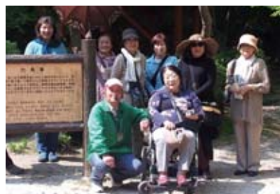
▲観光ボランティアとして広島俳句の会のメンバーを吉香公園へ案内