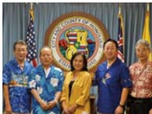
▲表敬訪問(ホノルル市役所)

でしょうか。 また、滞在中は、ハワイ州政府やホノルル市役所などを表敬訪問するとともに、山口県人会の皆さまと交流会を通じ「ふるさと山口」の話で盛り上がり、ハワイに暮らす皆さまが故郷をこよなく愛しておられることを改めて肌で感じました。 今後も、ハワイとの交流が未永く続くことを願いますとともに、チャーターフライトにご協力いただきました全ての皆さまに、心から感謝とお礼を申し上げます。