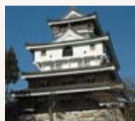
▲昭和37年建築の模擬天守