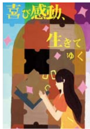
平成24年度 入賞作品

内(小学生)・4枚以内(中高生) ※一人一点、未発表作品 ※入賞作品には賞状・副賞を贈呈 募集期限 9月13日(必着) 申込 住所、氏名、学年、学校名を記入し、直接、青少年課 ☎0901