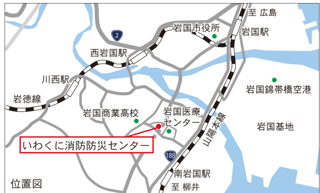
岩国市防災学習館