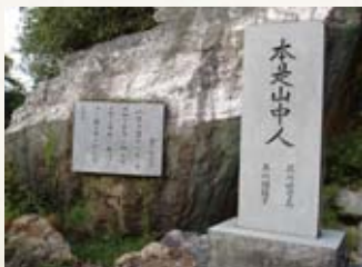
真教寺の境内にある芥川龍之介父子碑

※1 長州藩の行政単位で宰判のこと。代官が治めていた ※2 庄屋の支配管内のこと