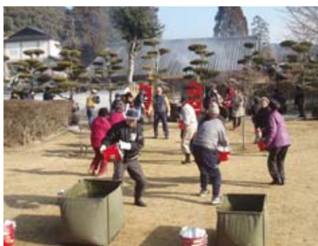
▲一昨年の旧目加田家住宅での訓練

は毎年文化財から出火したことを想定した消防訓練を実施しています。 日時 1月22日(金) 10時～ 場所 県指定有形文化財「香川家長屋門」(横山二丁目) ☎文化財保護課 ☎40452