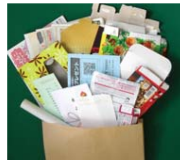
▲紙袋を「雑がみ入れ」として使用すると便利です