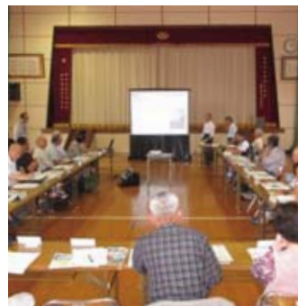
▲IJU（移住）応援団交流会での発表風景