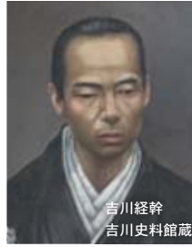
吉川経幹

●岩国幕末ものがたり 1. 経幹周旋編 日時 11月8日(日)まで 9時～17時 内容 ペリーの来航から禁門の変、第一次長州出兵までの大局と岩国の果たした役割を紹介 入場料 無料