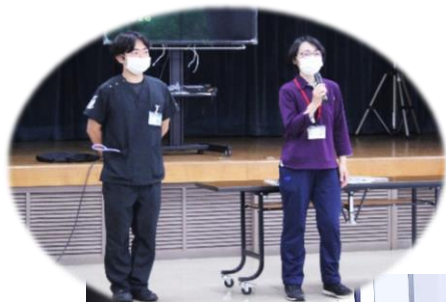
岩国市岩国第五地域包括支援センターの保健師さんと錦中央医院の研修医さんが初めに挨拶