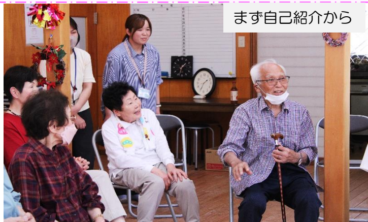
まず自己紹介から

5/29（金）美川保健センターに実習で来ているYMCAの学生5名の「めざせ！健康長寿～高血圧編」が、美川河山老人作業所で行われました。福寿会の方々を前に、初めは緊張気味だった実習生の皆さんでしたがレクリエーションを進めていく内に緊張がほぐれたようです。本題に入ってからクイズ方式で応答したり血圧の仕組みを寸劇で表したりと分かりやすく、皆さんも自分の体調や生活習慣などを聞いてもらい、アドバイス等を受けとても満足な様子で、「またやって欲しい！」と大好評でした。