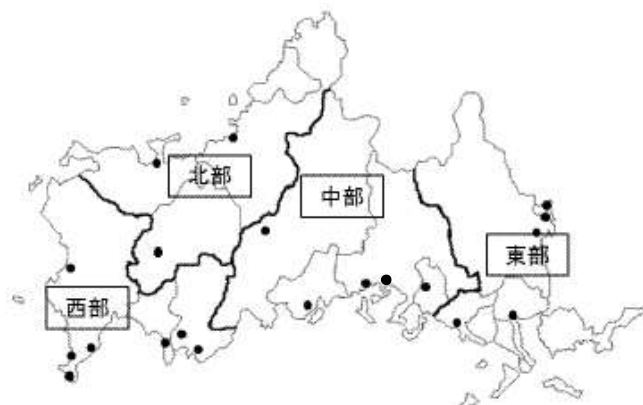
図1 注意喚起実施の区域区分 (●測定局)

エ 県はホームページ、関係機関へのFAX通知、メール配信サービス、テレホンサービスにより、注意喚起等の周知を行っている。