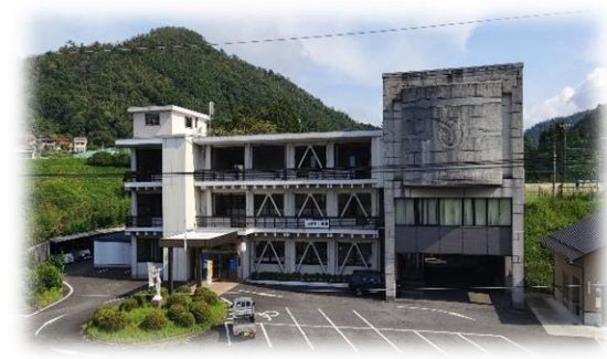
美和総合支所庁舎 明神原なごみ広場桜まつり

美和町は、定住された元地域おこし協力隊員や集落支援員など、たくさんの人材が活躍しています。