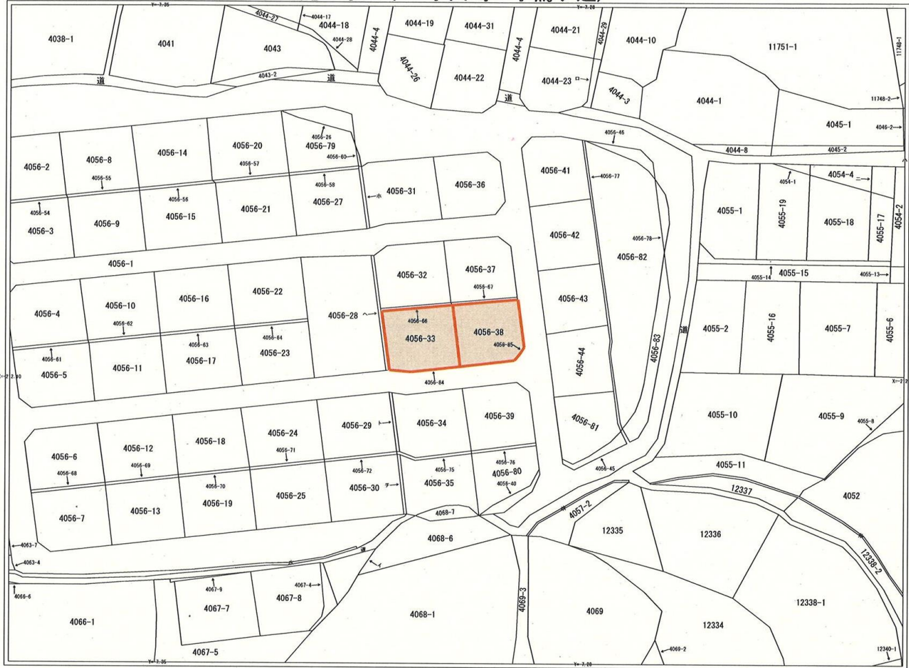
岩国市集成図(字井ノ尻・字内免・字正平・字山崎・字鷺ヶ迫)