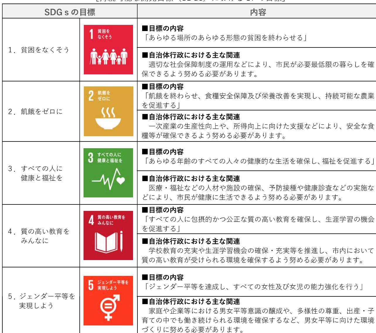
[持続可能な開発目標（SDGs）における 17 の目標]

このことから、本市においても、持続可能な開発目標（SDGs）を考慮し、地域における自律的好循環や持続可能なまちづくりを目指した取組を推進することで、政策の推進、地域課題解決の加速化等の相乗効果を創出し、地方創生の更なる実現につなげていきます。