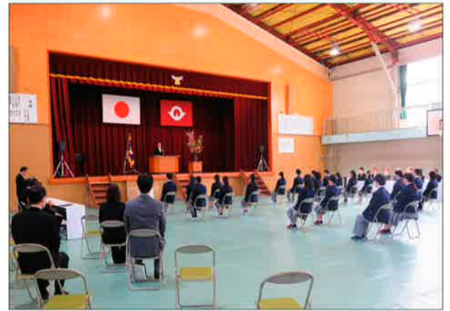
岩国高等学校坂上分校