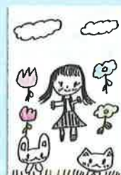
一年 シナモンさん