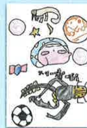
二年 マークンさん