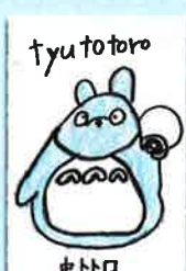
四年 ヒコウキさん