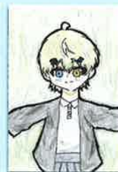
六年 あかりんさん