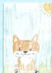
四年 イネすきさん