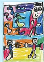
一年 チヨロルさん