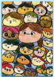
六年 ふじつなぎさん