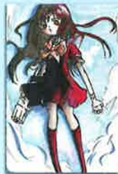
六年 たなちゃんさん