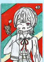
五年 あいびーさん