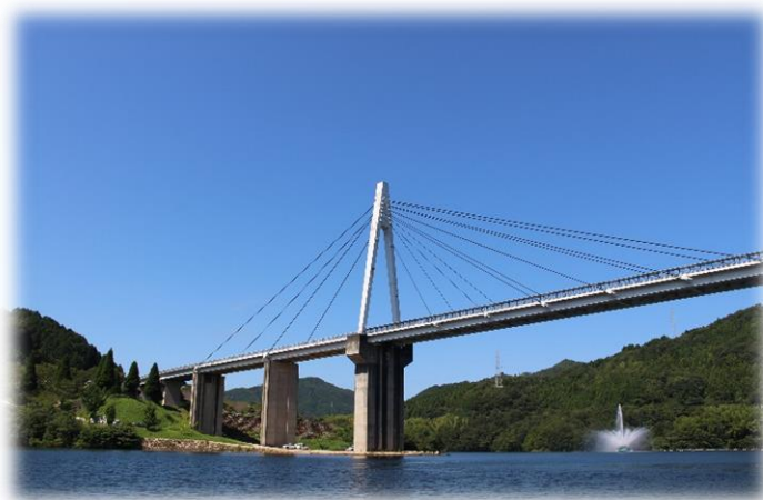
〈弥栄湖にかかる弥栄大橋〉

秋：「ドッグフェス in みわ」の開催支援や、特産品「がんね栗」の観光栗園の運営・PR 活動など、多様なイベントをサポートします。これらの経験を通じて、効率的に動くコツを身につけられます。