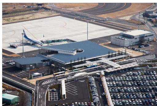
市の中心部にある岩国錦帯橋空港