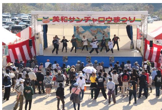
美和サンチャロウまつり さくら街道・美和マルシェ