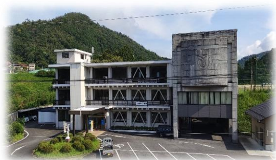
美和総合支所庁舎 明神原なごみ広場桜まつり

美和町は、定住された元地域おこし協力隊員や集落支援員など、たくさんの人材が活躍しています。