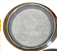
そば粉 と そば殻