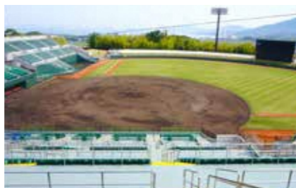
野球場 (絆スタジアム) ※ 12月から約3ヶ月は養生期間