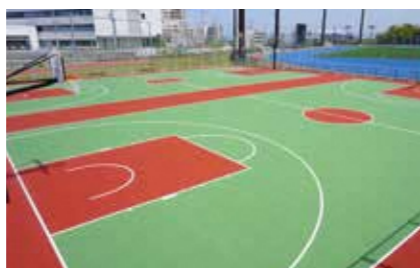
バスケットボールコート