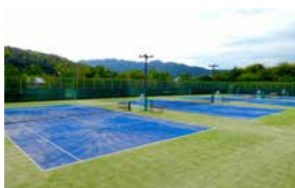
テニスコート (オムニコート16面)