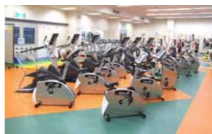
トレーニングルーム