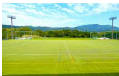
人工芝グラウンド