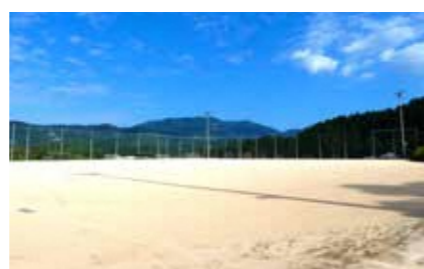
多目的グラウンド