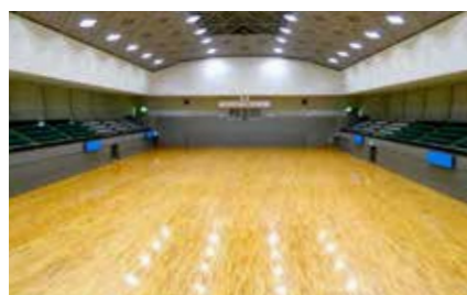
総合体育館 (アリーナ)