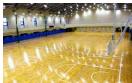
カルチャーセンター (アリーナ)