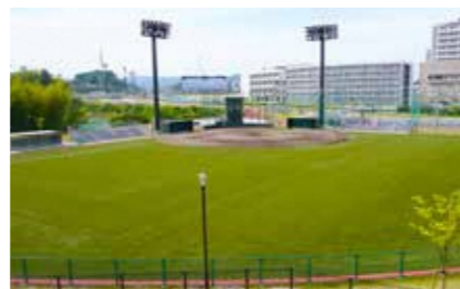
ソフトボール場 (人工芝2面)