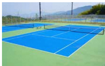
テニスコート (ハードコート4面)