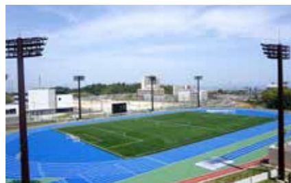
陸上競技場 (55 フィールド)