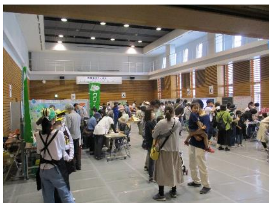
岩国環境フェスタ