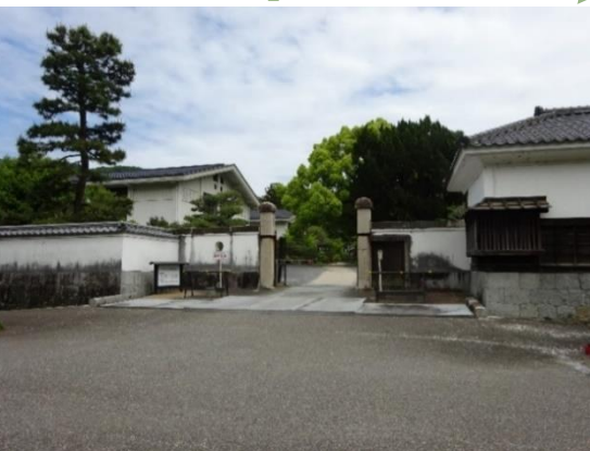
サンライフ岩国 入口