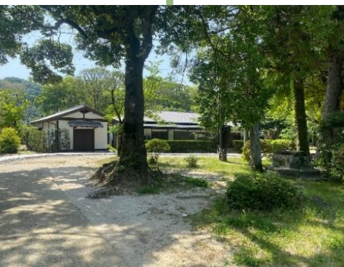
サンライフ岩国を抜けたところ