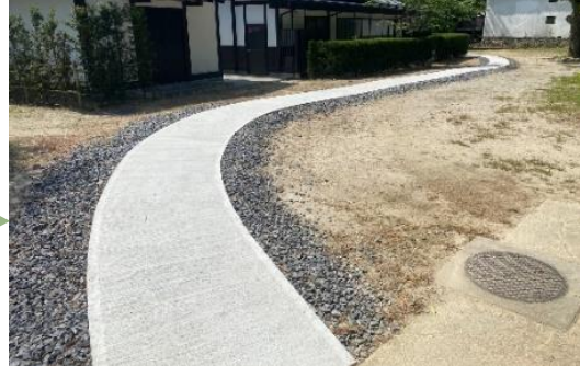
ずっと進んでいくと左側に茶室が