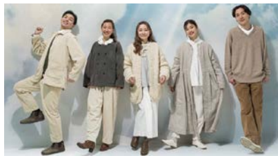
歌：ザ ブリーズアドベンチャーズ