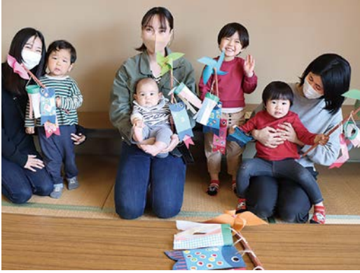
完成したこいのぼりを片手に、子供たちは満面の笑みを浮かべた