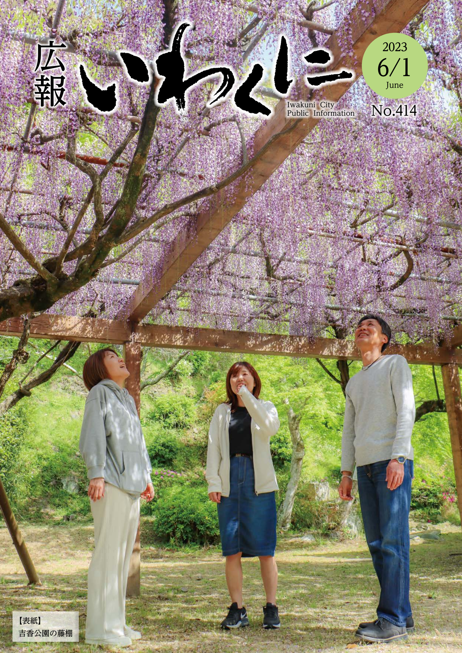
【表紙】 吉香公園の藤棚