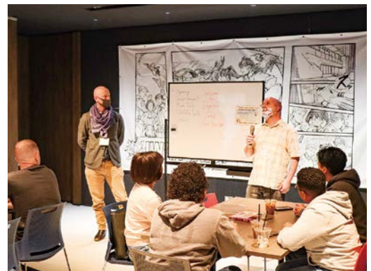
英語を学びたい市民が気軽に話すことができるよう、 イベントはアットホームな雰囲気で行われた

4月22日、岩国市英語交流セ ンター「PLATABC」で 国際交流カフェが開催されまし た。