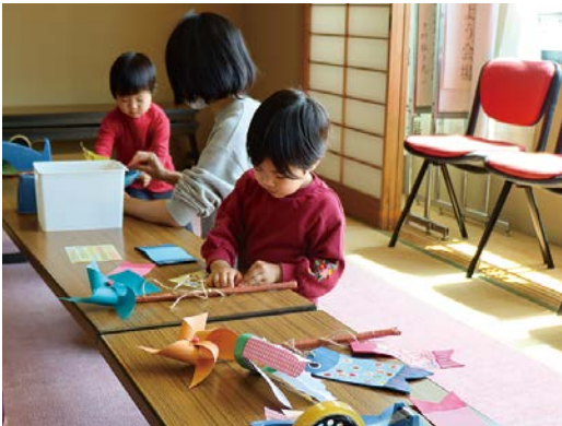
子供たちはお母さんや先生に作り方を聞きながら、自 分だけのこいのぼりを作った