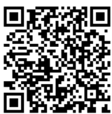
職員採用専用サイト