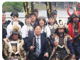
鉄砲隊5団体の皆さんと（錦帯橋まつり）

今年のゴールデンウィークは、全国各地の観光地や行楽地で、イベント等も再開される中、久しぶりに多くの人で賑わいました。