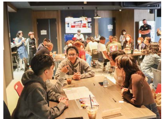
設定されたトークテーマについての発表や感想などの 意見交換は、全て英語で行われる