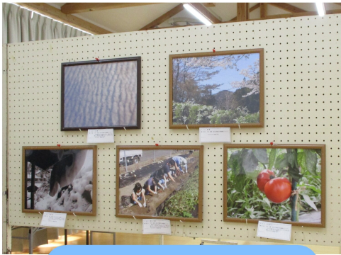
下畑の風景や昔の写真