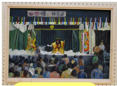
どちらも力作です!