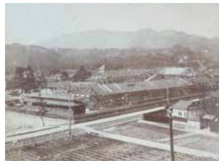
岩国尋常小学校校舎改築状況写真