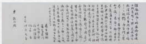
東敬治宛沖原光孚ほか5名書簡