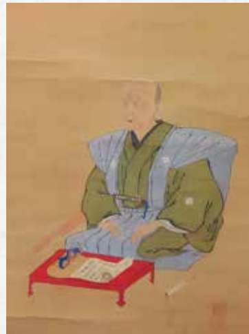
青龍軒盛俊(初代)肖像画

表面の資料名:①二宮俊実像 ②牛図(内田耕月筆) ③南部五竹先生絶筆 ④僧図(東沢瀉筆) ⑤刀(蒼龍軒盛俊作)