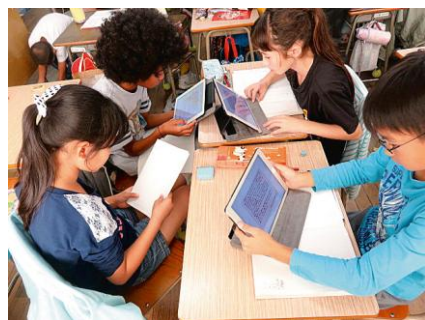
小中学校タブレット端末等整備事業