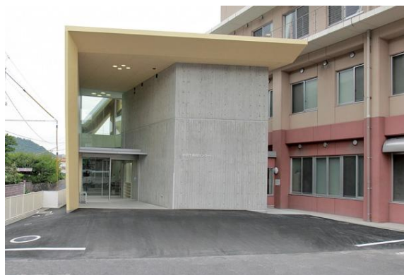
岩国市療育センター