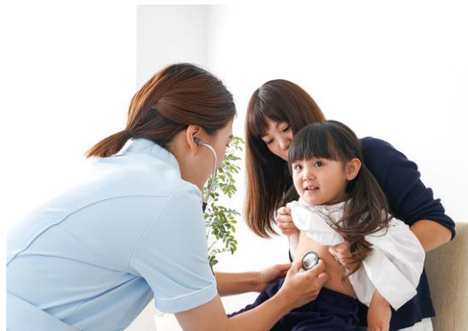
こども医療費助成事業