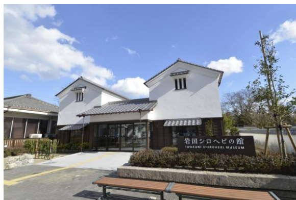
横山シロヘビ資料館整備事業