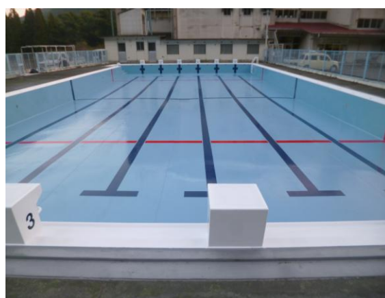
小中学校プール整備事業