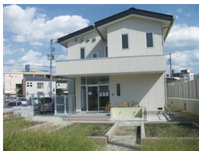
麻里布放課後児童教室整備事業