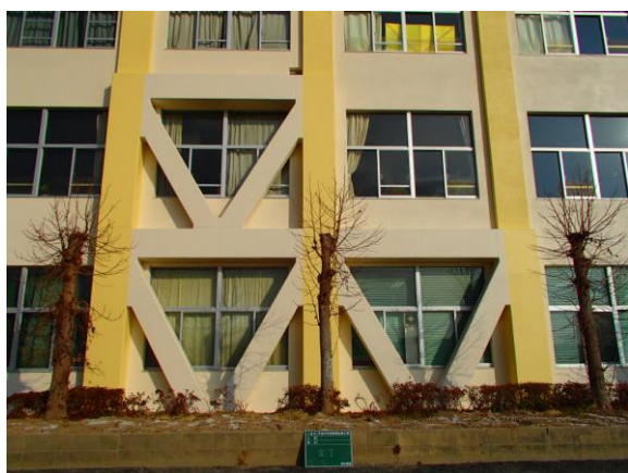
学校施設耐震補強事業