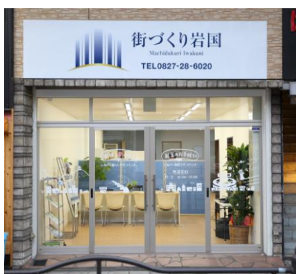
まちなか商店リニューアル助成事業