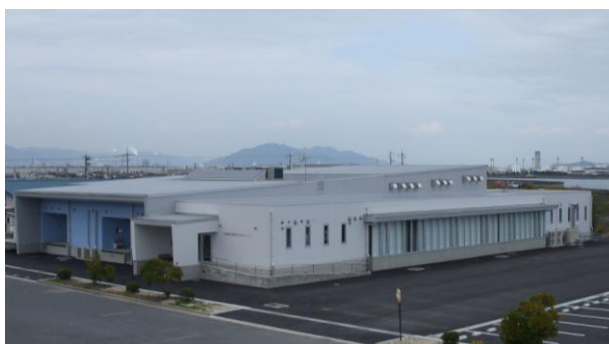
岩国市学校給食センター