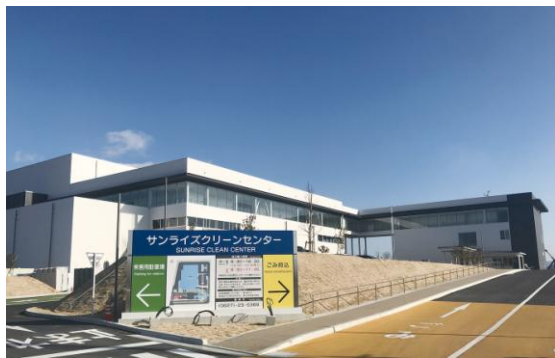
ごみ焼却処理施設建設