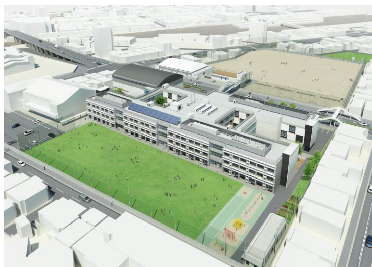
東小・中学校（防音工事）