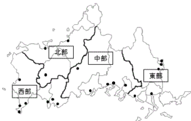
図1 注意喚起実施の区域区分 (●測定局)

エ 県はホームページ、関係機関へのFAX通知、メール配信サービス、テレホンサービスにより、注意喚起等の周知を行っている。