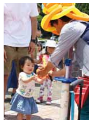
くが青空マルシェ (玖珂総合公園)

5月27日、玖珂総合公園で「くが青空マルシェ」が開催されました。訪れた人たちは、手の込んだハンドメイド作品を一つ一つ手に取って眺めたり、人気キャラクターのバルーンアートに目を輝かせたりして、にぎやかな休日を過ごしていました。