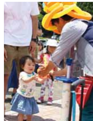
くが青空マルシェ (玖珂総合公園)

5月27日、玖珂総合公園で「くが青空マルシェ」が開催されました。訪れた人たちは、手の込んだハンドメイド作品を一つ一つ手に取って眺めたり、人気キャラクターのバルーンアートに目を輝かせたりして、にぎやかな休日を過ごしていました。