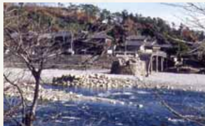
▶昭和25年撮影