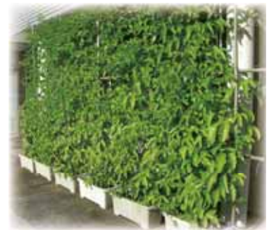
▲緑のカーテンには蒸散効果があるため、すだれよりも効果的です

人の数も年々増加する傾向にあります。これから本格的な夏を迎えるに当たり熱中症対策は極めて重要です。