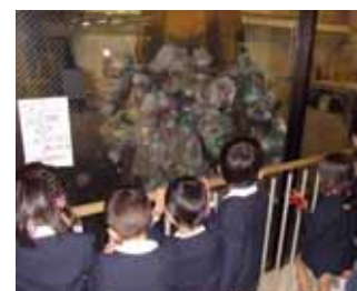
▲リサイクルプラザの見学風景

処理費用は、処理に要する経費と排出量から単純に計算したもので、実際の金額とは異なります