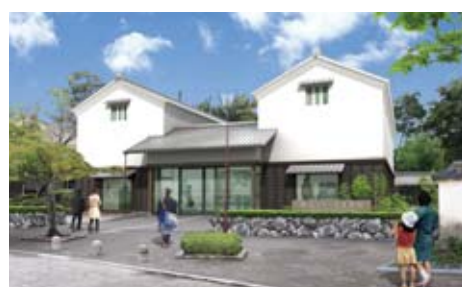
▲(仮称) 横山シロヘビ資料館イメージ

人件費においては、定員管理適正化の着実な推進を図り、また公債費においては、将来負担の軽減を図るため、市債発行額を抑制し、市債の発行に当たっては、財政的に有利な普通交付税算入率の高い市債の活用を努めました。