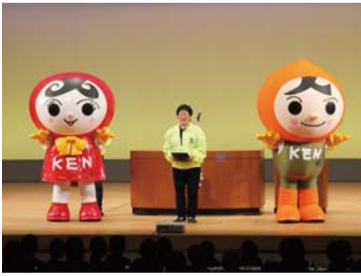
▲会場に呼び掛ける「人KENまもるくん・あゆみちゃん」

表彰式と朗読の合間には、人権イメージキャラクターの「人KENまもるくん・あゆみちゃん」が登場し、人権の大切さや人権擁護委員の活動について説