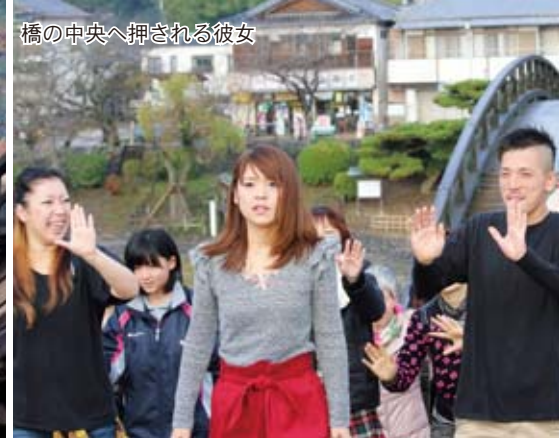
橋の中央へ押される彼女

11月29日、岩国市の知名度向上を目指したプロモーションビデオの撮影が錦帯橋で行われ、公募により集まった多くの市民が息を合わせて踊りました。11月16日から市内各地で撮影が進められ、今回はけんかしたカップルを岩国市民が協力し、錦帯橋の中心で再会させるというシーンが撮影されました。参加者は錦帯橋の両端に分かれると、現代風にアレンジされた「岩国よいとこ」の音楽に合わせて踊ったり手拍子をしたり