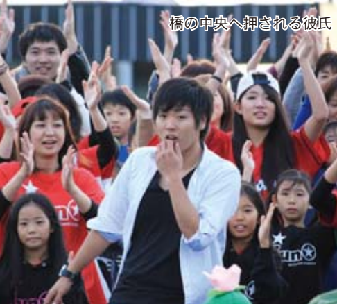
橋の中央へ押される彼氏