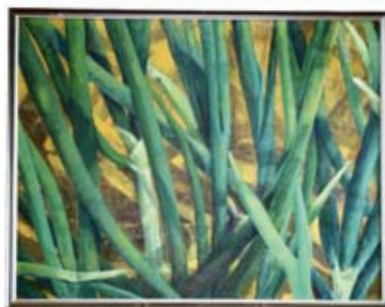
▲入賞作品「日ざし」 (横116cm×縦92cm)

「集中して描いている間は、自分の気持ち落ち着きます。また絵で知り合った仲間がいることが幸せです。その仲間と絵の鑑賞を兼ねて旅行すると楽しくて。絵は私の生きがい。元気で筆が持てる間は絵を続けていくことが目標です」と話してくれました。