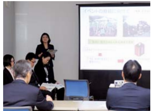
▲案の発表を行う若手職員