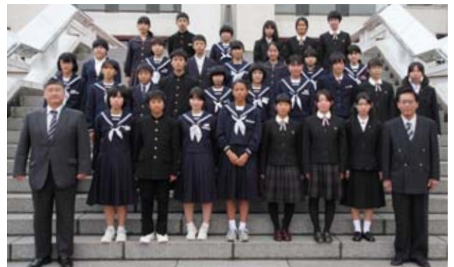
▲表彰式に参加された皆さん