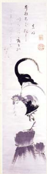
◀『鶏図賛』 伊藤若冲筆、熊谷直好賛

絵師と歌人、年の離れた2つの才能が見事に融合した芸術作品といえるのではないのでしょうか。