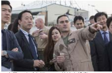
▲米国アリゾナ州のユマ基地を視察

その上で、11月29日に国が「安全性に問題はない」旨説明していることや12月16日の市議会全員協議会の質疑などを踏まえ、安全性