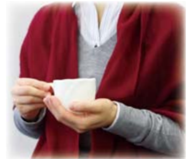
▲ショールを羽織ると体感温度が上がります

岩国市地球温暖化対策地域協議会では、皆さんに楽しみながら節電・省エネに取り組んでいただくために、省エネ川柳を募集しました。応募のあった192人・298句の中から、最優秀賞、優秀賞に選ばれた作品を紹介します（佳作に選ばれた28作品は市のホームページに掲載しています）。