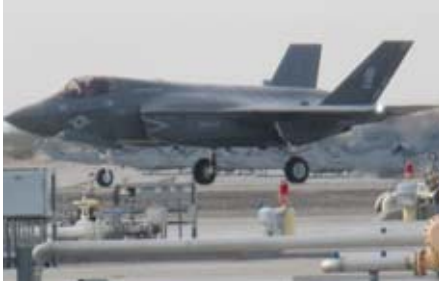
▲ユマ基地に配備されているF-35B