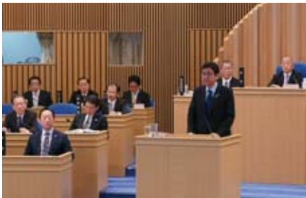
▲全員協議会で発言する岸外務副大臣