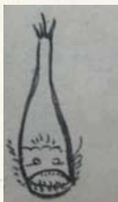
▲岩邑年代記に描かれたアンコウ

岩国で話したもので、太さ（胴回り）が2〜3寸（約6〜9cm）、長さが1尺（約30cm）で竹のような筋があり、真つすくな魚だったそうです。当時、ヤガラは臍症（飲食物が胸に詰まるように感じる病気で、現在の胃がん、食道がんにあたる）といわれるの妙薬になるといわれていたことも記されています。このように、カメラもない江戸時代の岩国の人々は、珍しい魚を見つけた際、スケッチをして記録に残していたのでしよう。