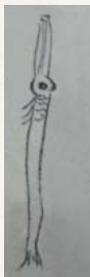
▲岩邑年代記に描かれたヤガラ