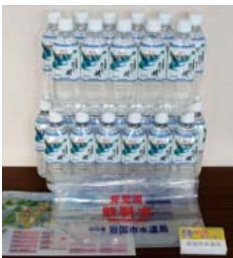
▲ふるさとと産品の一例