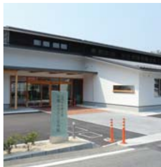
▲本郷ふるさと交流館が併設された本郷支所