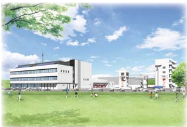
▲いわくに消防防災センターイメージ図

5月24日、翌日行われるシーカヤック大会と翌週の長崎国体選手選考会に備えて、中山湖で練習が行われていました。この日練習に参加したのは、山口県ジュニアカヌークラブに所属しているメンバーと、県内で唯一カヌー部がある高森高等学校の生徒です。初夏の日差しの下、輝く水面を威勢よく漕ぎ進んでいました。