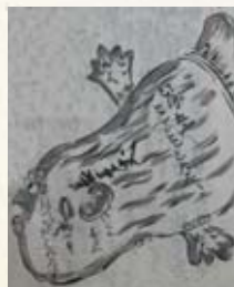
▲玖珂郡志に描かれたマンボウ