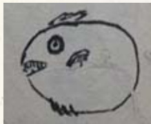
▲岩邑年代記に描かれたマンボウ

ヒレからヒレまでは9尺という大きさだったようです。また、絵以外にも多くの情報が書かれており、当時の呼び名はマンフクで、それが浮木 うきぎ （マンボウの別名）のことであるということ、室の木の人が扇魚、大分の人は大ナンブク、九州ではマンボウ、西日本ではアバラボウと呼ぶなど、地域によって呼び名がさまざまであったことも分かります。その他にも、全身がさめ肌でイカの身に似ていることや、肉を切っても痛みがなく、海に浸っていると元通りになるといったことも書かれています。どちらの資料も絵入りで記録していることから、マンボウは当時の岩国の人々にとっても珍しい魚だったのだでしょう。