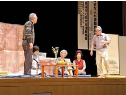
▲認知症高齢者への対応の仕方を寸劇で説明

また同日、シンフォニア岩国で「岩国市認知症高齢者の見守り支援協議会」が活動報告会を開き、専門医による認知症に関する講演や、認知症高齢者への接し方を説明する寸劇を披露しました。寸劇では、認知症高齢者が病院に行きたがらないなど家族の苦労や病院に連れて行くコツ、地域の協力の必要性などを紹介していました。 ☎ 2566 園地域包括支援センター