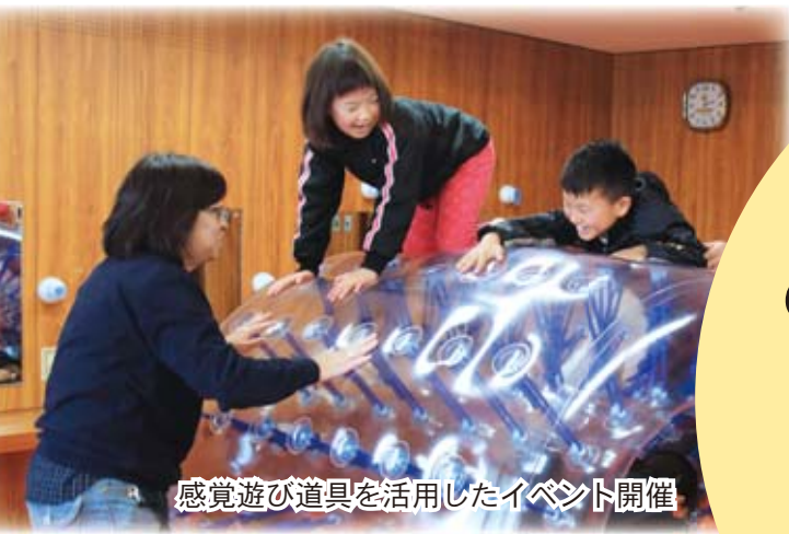
感覚遊び道具を活用したイベント開催