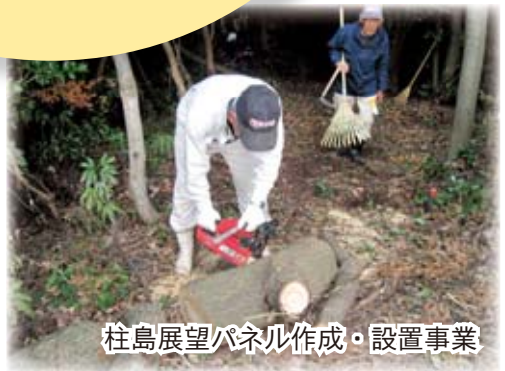
柱島展望パネル作成・設置事業