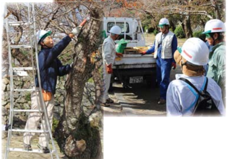
錦帯橋周辺に植栽されている桜の手入れ