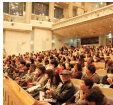
▲大勢の観客の熱気に包まれた会場