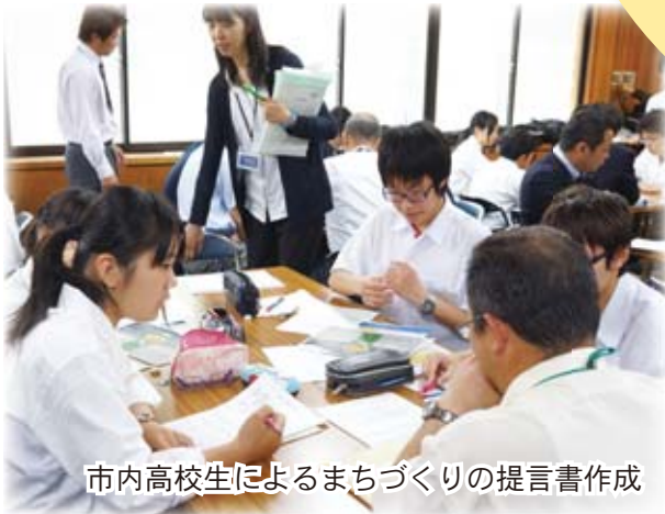
市内高校生によるまちづくりの提言書作成