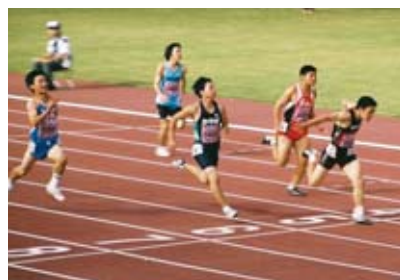
▲ぎふ清流大会では100mで銅メダルを獲得(右から2人目)