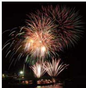
▲約6,000発の花火が打ち上げられる「錦川水の祭典」