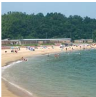
▲市内唯一の海水浴場「みなとオアシスゆう」