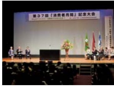
昨年の開催会場、萩市で行われた記念大会の様子