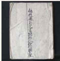
▶ 朝鮮人好物附之写