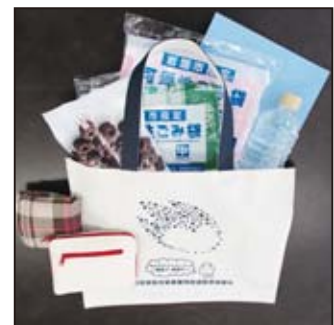
▲マイバッグは数枚用意し、どこでも使えるようにしましょう

資源を大切に使うポイントとなる3Rとは、リデュース (Reduce)・リユース (Reuse)・リサイクル (Recycle)。その中の1つリデュースは、廃棄物となるものの発生自体を抑制することをいい、例えばマイバッグの持参によるレジ袋の削減などが含まれます。 山口県のレジ袋辞退率は92.1%で、容器包装削減に大きな成果を上げています。 今後、一層の削減を推進するため、お買い物の際には不要なレジ袋は辞退しましょう。 注意点として、お店に入ったらお店のカゴを使い、誤解を受けないよう、マイバッグは手に持たずに折り畳んでおきましょう。 ※県ホームページから(平成27年3月31日現在)