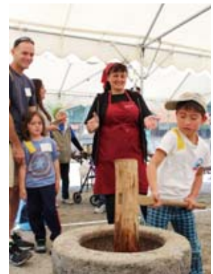
日米交流事業「餅つき」 （旧天尾小学校）

4月16日、旧天尾小学校で日米交流事業として「餅つき」が行われました。海兵隊岩国航空基地の家族と一般の親子連れなど約100人が参加し「よいしょ！」と元気な掛け声に合わせて、一生懸命きねで餅をついていました。