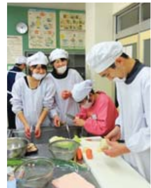
郷土料理教室 (玖珂中学校)

● 国所定の申請書(ホームページからダウンロード可)に必要な書類を添えて、直接または郵送で契約監理課へ提出 ☎ 契約監理課 ☎ 29 5 0 6 4