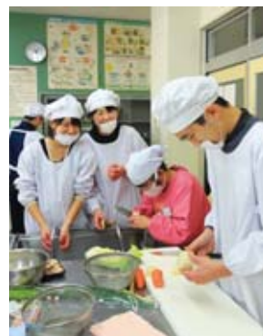
郷土料理教室 (玖珂中学校)

● 国所定の申請書(ホームページからダウンロード可)に必要な書類を添えて、直接または郵送で契約監理課へ提出 契約監理課 ☎ 29 5 0 6 4