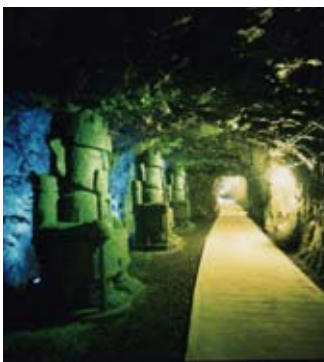
▲地底王国美川ムーバレー