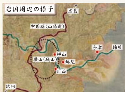
◀『岩国領全図(部分)』 寛文8(1668)年に描かれた 絵図で、細かく岩国を描いた 絵図の中では最も古いもの

これは、吉川氏が横山を選んだ理由として、統治の面だけでなく、軍事的要害としての機能も重視していたためであり、交通の要地を押さえるとともに、錦川や横山(城山)を防衛に利用する目的があったと考えられます。