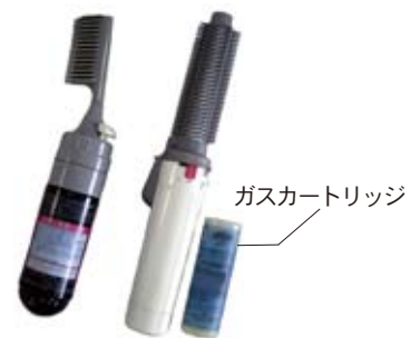
▲ヘアマニキュア容器とヘアカーラー