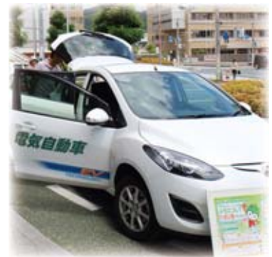
▲環境フェスタで展示されたエコカー

コ住宅を建てる・エコ家電にするという「選択」、高効率な照明(LED)に替えるという「選択」、公共交通機関・自転車を利用するという「選択」、クールビズ、ウォームビズをはじめ、消灯・節水・温度調節などの低炭素なアクションを実践するライフスタイルの「選択」をする運動のことです。