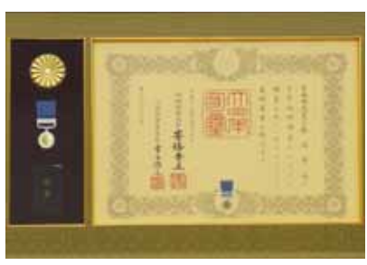
▲社会福祉や公共の事務などで功績のあった人に贈られる藍綬褒章