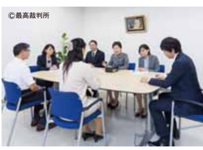
▲調停は裁判所で非公開で行われ、誰でも簡単に低額で利用できる