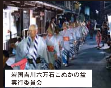
岩国吉川六万石こぬかの盆 実行委員会

市民に岩国市の景観を身近に感じ、意識・関心を深めてもらうことを目的とした「いわくに景観賞」の表彰式が、1月26日に市役所で行われました。 この賞は付近の景観を引き立たせる建造物、良好な住環境や自然環境を守り育む活動などに携わる人々を表彰するもので、昨年6月に募集し、建造物部門とまちなみ・まちづくり部門で各7件の応募がありました。 岩国市景観まちづくり委員会による評価・選考の結果、建造