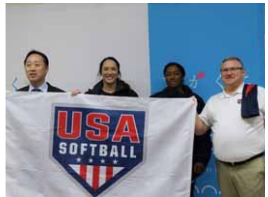
▲視察に訪れた米国代表チームのディレクター（右）と選手（中央2人）