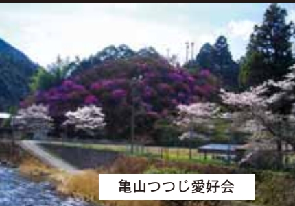
亀山つつじ愛好会