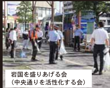
岩国を盛りあげる会 (中央通りを活性化する会)