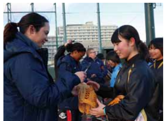
▲交流の最後に、選手は小・中学生と握手をしたり、グローブなどにサインをしたりした