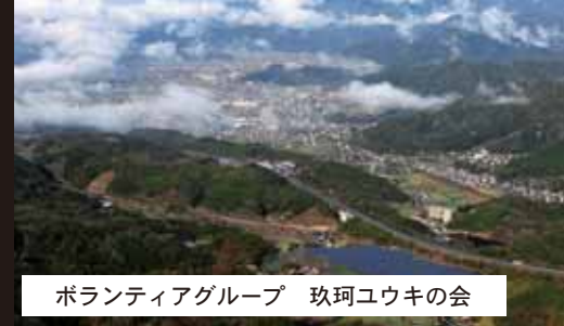
ボランティアグループ 玖珂ユウキの会