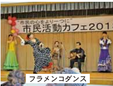
フラメンコダンス