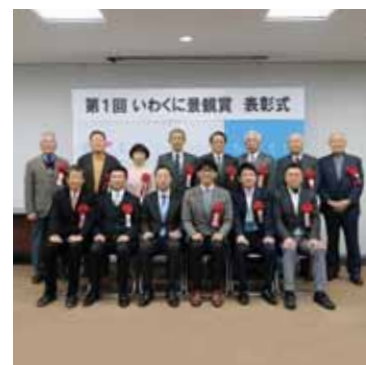
▲表彰式に出席した受賞者