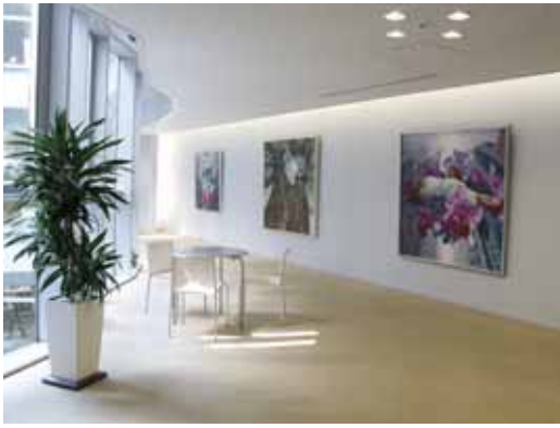
▲庁内に作品を展示し、来庁者も気軽に芸術を鑑賞できる「市役所まるごと美術館計画」の事例

審査の結果、本庁の壁面などを利用して市内の芸術団体の作品を展示する、文化振興課の「市役所まるごと美術館計画」が金