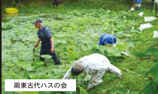
周東古代ハスの会