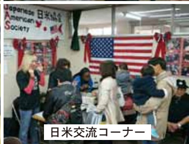
日米交流コーナー