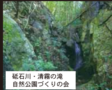
砥石川・清霧の滝 自然公園づくりの会