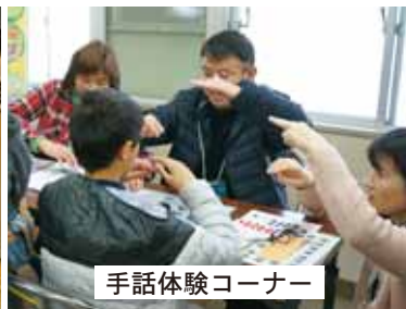
手話体験コーナー