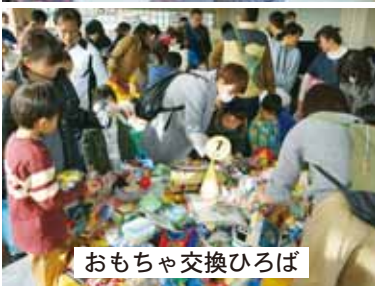
おもちゃ交換ひろば