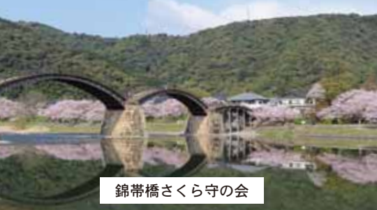
錦帯橋さくら守の会