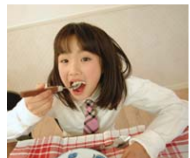
▲食べ物を残さず食べきることも、ごみの減少につながります