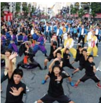
▲昨年の岩国祭（岩国よいとこ総踊り）