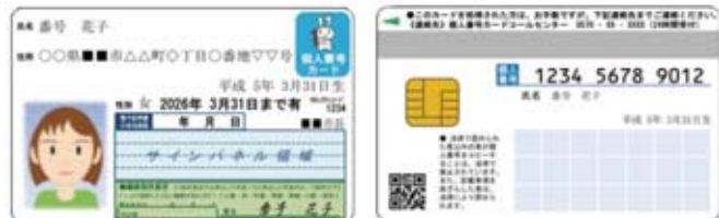
個人番号カード (イメージ) 表/裏