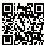
▲携帯電話用 QRコード