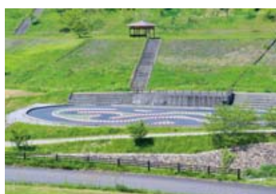
▲公園の一角にはラジコンコースがあり、週末には大会も行われる