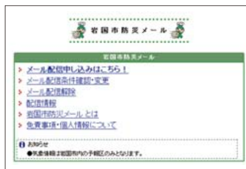
▲岩国市防災メール申込手続き画面