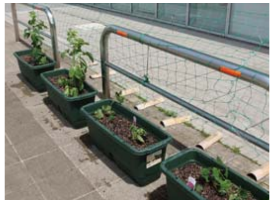
▲緑のカーテンは断熱効果があるだけでなく、植物観賞や果実の収穫ができるのも魅力