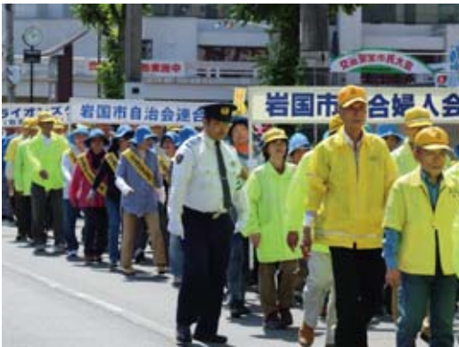
▲商店街など市中心部で交通安全パレードを行った

大会終了後、一行は岩国地区消防組合音楽隊を先頭に交通安全パレードに出発し、通行人らに交通安全を呼び掛けました。岩国市民協働推進課 ☎5018