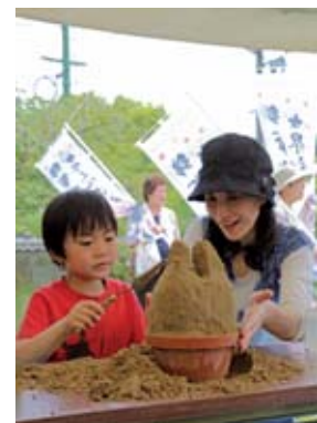
ミニ砂像をつくろう！ (吉香公園)

4月29日「錦帯橋まつり」の行事の一環として、鳥取市との姉妹都市提携20周年を記念し、ミニ砂像作りが行われました。参加した親子連れ約70人は、鳥取の日本神話「因幡の白兔」にちなみ、鳥取砂丘の砂の塊を削って高さ約30cmのウサギの像を完成させていました。