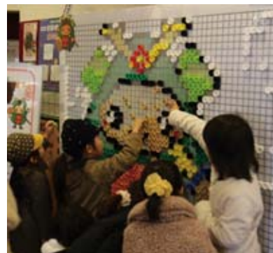
▲エコキャップアート