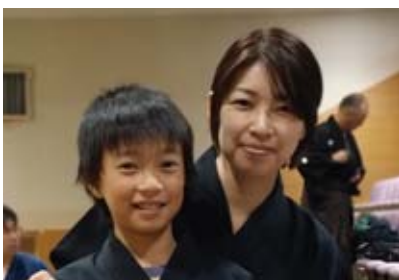
▲趣味は歴史好きが高じて始めた居合道。腕前はなんと2段。

「わらべうた遊びの楽しさは実際に体験してみないと分かりません。大人も子供も含めて、わらべうたを樂しめる場がもっと広がったらいなと思っています。遊びの中から、音楽ってこんなに楽しいんだ、という思いが広がっていくとうれしいです」