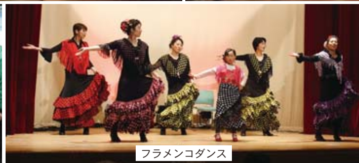
フラメンコダンス