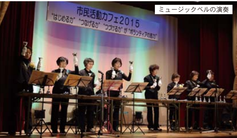
ミュージックベルの演奏