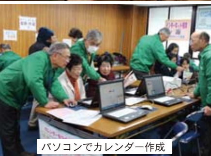
パソコンでカレンダー作成