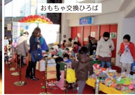
おもちゃ交換ひろば