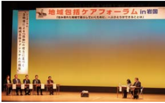
▲活動状況や意義などが紹介されたシンポジウム