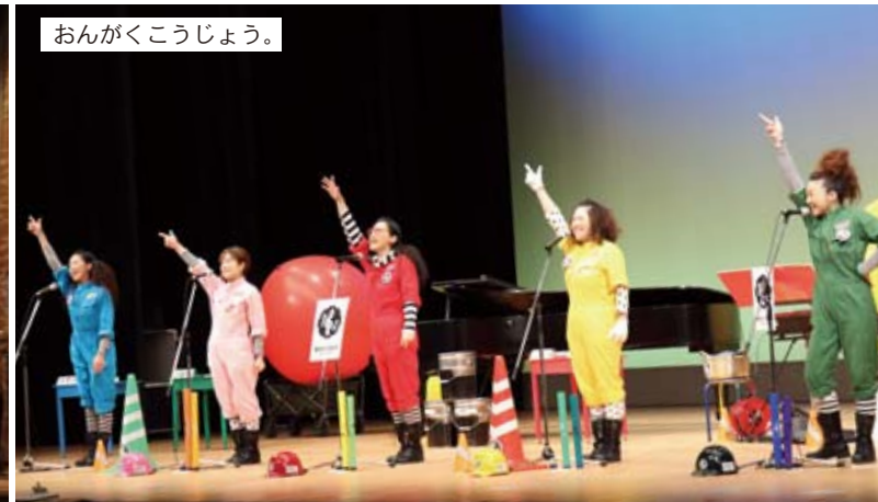
おんがくこうじょう。