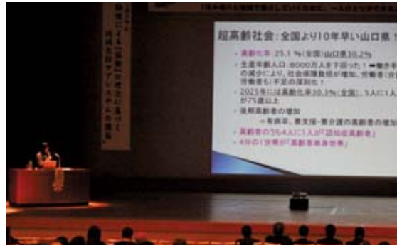
▲社会的孤立が増えるなどの実態報告があった基調講演