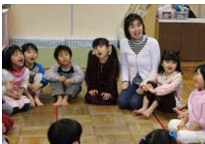
▲みんなで輪になってわらべうたあそび。園児には笑顔が絶えない。