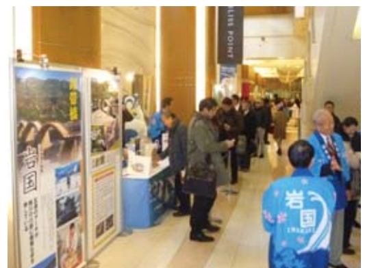
▲多くの人が訪れた抽選会