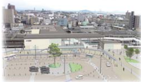
▲岩国駅西口イメージ図：岩国市作成

人件費においては、定員管理適正化計画の着実な推進を図り、また、公債費においては、将来負担の軽減を図るため、市債発行額を50億円以下に抑制するとともに、市債の発行に当たっては、財政的に有利な普通交付税措置の高い市債の活用を努めました。